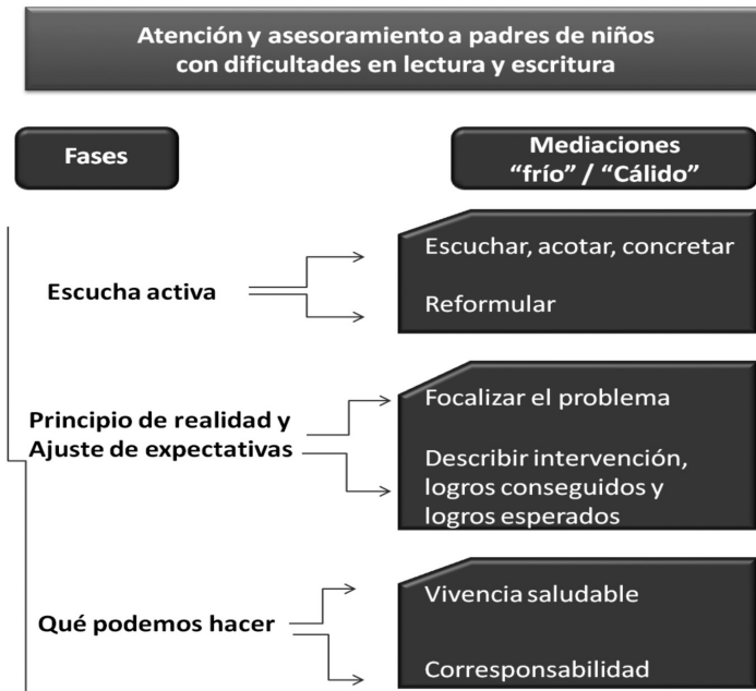
Figura 3. Fases y Mediaciones en el procedimiento de atención y asesoramiento a padres de niños con DALE (tomado de Rueda y Sixte, 2010)

ria reformulación. No obstante, la experiencia que tenemos hasta el momento nos muestra que los padres, con los que hemos trabajado, suelen tener un bagaje bastante amplio en la búsqueda de ayudas y/o soluciones que explica su visión bien delimitada y ajustada del problema que tienen entre manos. La reformulación sí se hace necesaria cuando, las ideas preconcebidas que traen los padres sobre lo que le pasa a su hijo, no les permite comprender adecuadamente sus dificultades y, por lo tanto, no están en disposición de poder ayudar. Por ejemplo, pueden pensar que las dificultades del niño se deben al hecho de no haber tenido las mejores condiciones en su desarrollo escolar, ó que "son vagos", que "no prestan atención", que lo saben hacer "cuando quieren"... Es decir, no perciben con claridad que su hijo tiene una dificultad, en ocasiones, específica en el aprendizaje lecto-escritor, ni las consecuencias que esto tiene para su aprendizaje, para su autoestima, su percepción de eficacia o su motivación. Es bueno hacerles ver, en este caso, que si bien algunas de las observaciones que ellos hacen