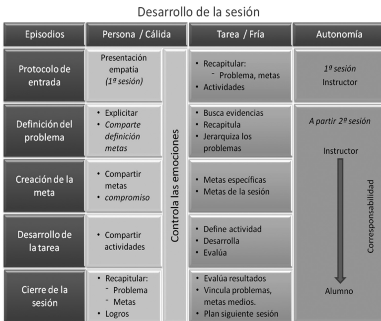
Figura 2. Fases en el desarrollo de una sesión de intervención con alumnos con DALE -adaptado de Hernández (2005) y Rueda (1995)

ta pasen a formar parte de las competencias propias del estudiante.