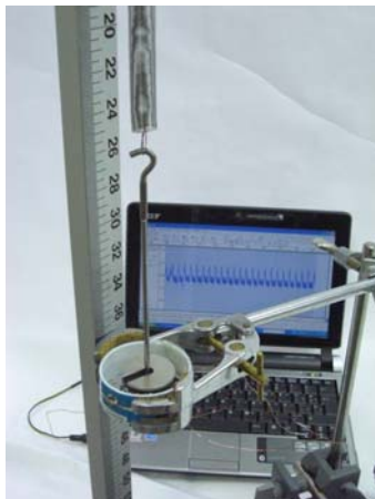
Figure 1: Imagen del dispositivo experimental utilizado para determinar el periodo de oscilación del sistema masa-muelle. El imán (no visible) está situado debajo del soporte.