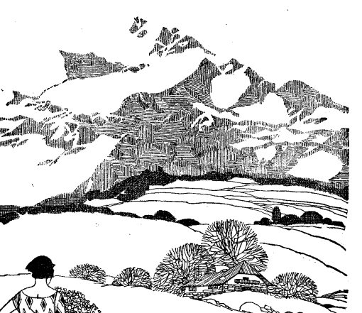
Firma del Rey

Este libro trata de la firma del Rey, un tema de gran importancia en el mundo de los instrumentos. El autor, Instrumentos Publica, aborda los aspectos técnicos y artísticos de la firma del Rey. Su obra es una valiosa contribución al conocimiento en este campo.