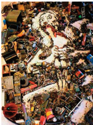
Vik Muniz. Relectura de Saturno de Goya, compuesta por objetos de desecho, en el suelo de una inmensa nave.

Siento que hay, más que una crisis en la creatividad, una crisis muy grande dentro del esquema dictado por el mercado del arte, que intenta, incansablemente, condicionar la creatividad hacia la producción transformación de las obras en cosas para fomentar tal mercado.