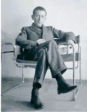
"La obra de arte es una realidad que la sociedad produce para corresponder a una necesidad real". Walter Gropius.