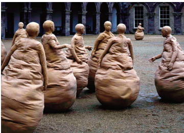
Obra del escultor español Juan Muñoz.