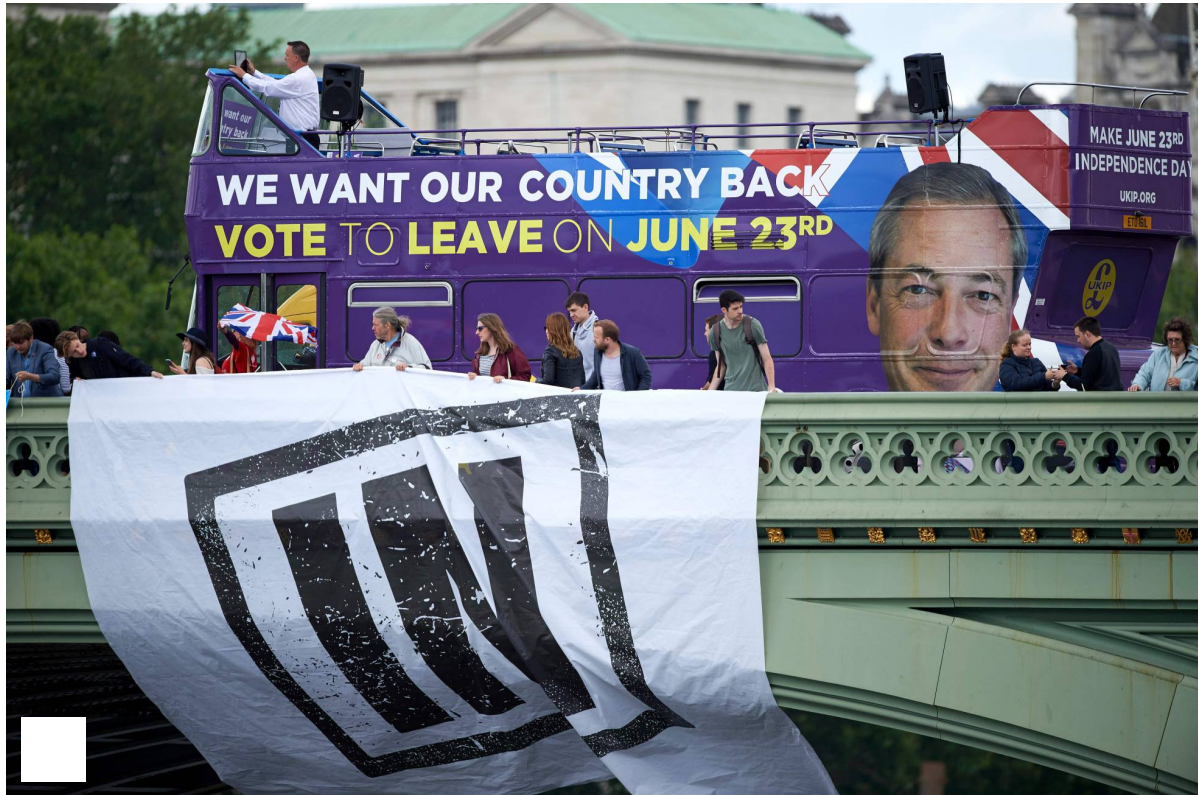
Referéndum Un autobús con publicidad a favor del 'Brexit' pasa por detrás de unos partidarios de la permanencia.