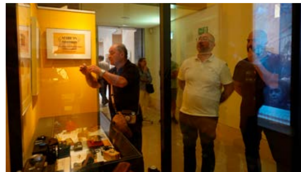
Segundo Encuentro Coleccionar Cámaras Antiguas, Madrid, 2024.

Los temas abordados incluyeron el fenómeno del coleccionismo, la figura de George Eastman, fundador de Eastman Kodak, con sus mitos y leyendas, las primeras cámaras fotográficas, las cámaras utilizadas en la investigación de delitos, las