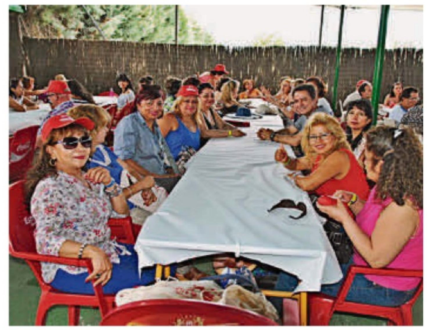
Una de las últimas caravanas de mujeres en la provincia en 2017.

La última vez que en Salamanca se organizó una caravana de mujeres fue en el verano de 2017