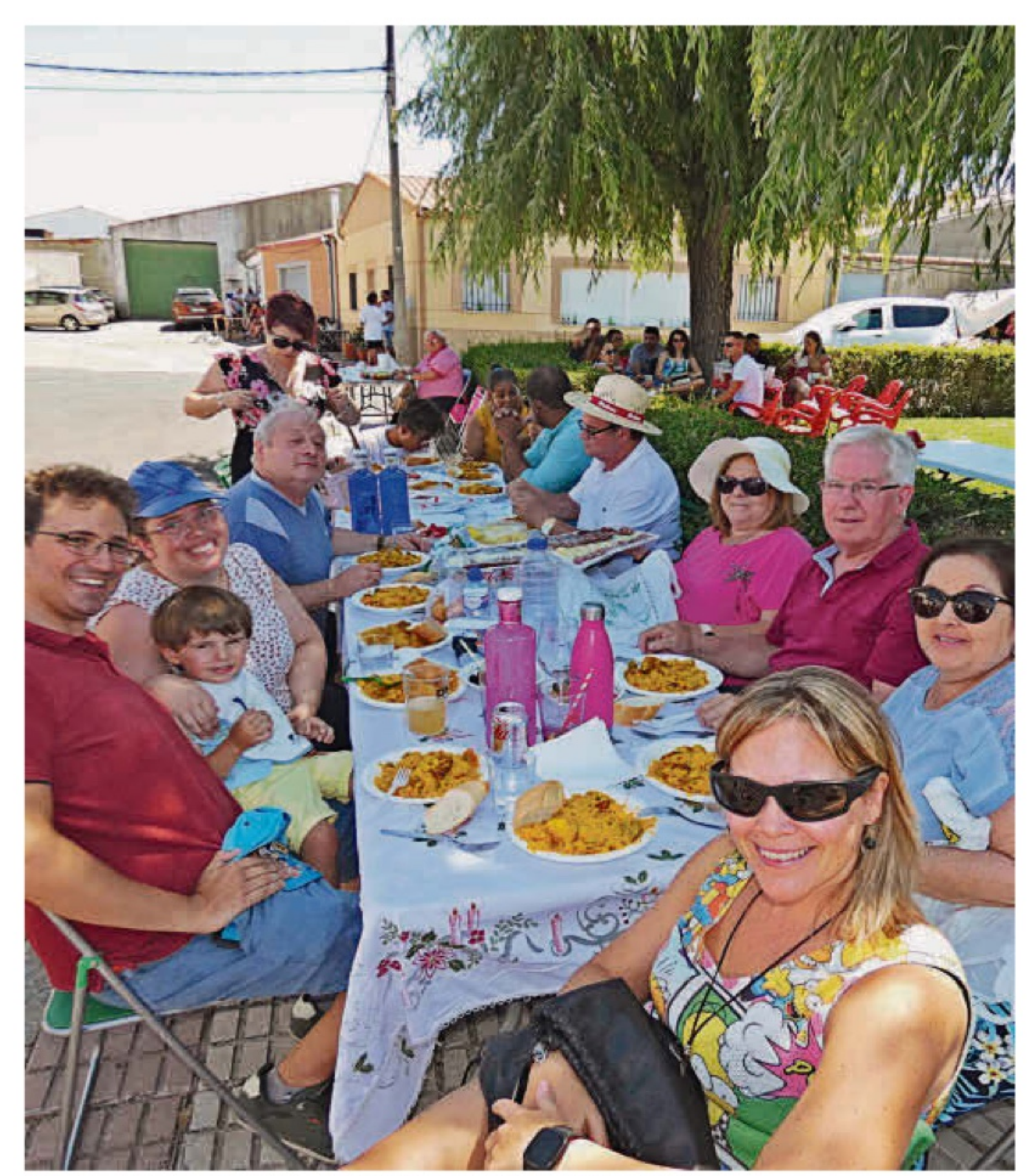
Comida vecinal en Villar de Gallimazo con motivo de las fiestas. | JORGE HOLGUERA

La ausencia de servicios básicos también representa un problema. La mayoría de municipios salmantinos no disponen de guardería, por ejemplo, lo que dificulta la conciliación de la vida familiar y laboral y afecta especialmente a las mujeres.