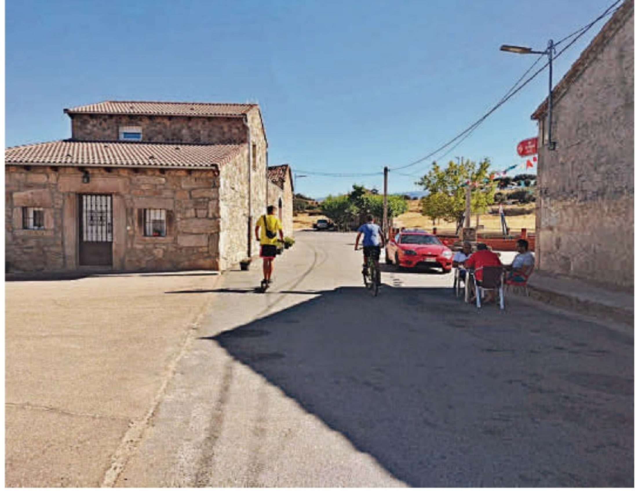
Jóvenes y hombres en la localidad de La Cabeza de Béjar.

El caso de Villar de Gallimazo es aún más llamativo porque, a diferencia de otras localidades, allí sí hay trabajo. Una fábrica de embutidos que da empleo a medio centenar de personas, otra de muebles, además de un almacén de fresas, a lo que se suman las tradicionales explotaciones agrarias. "La inmensa mayoría de los trabajadores no residen en el pueblo, lo hacen en otros o en la ciu-