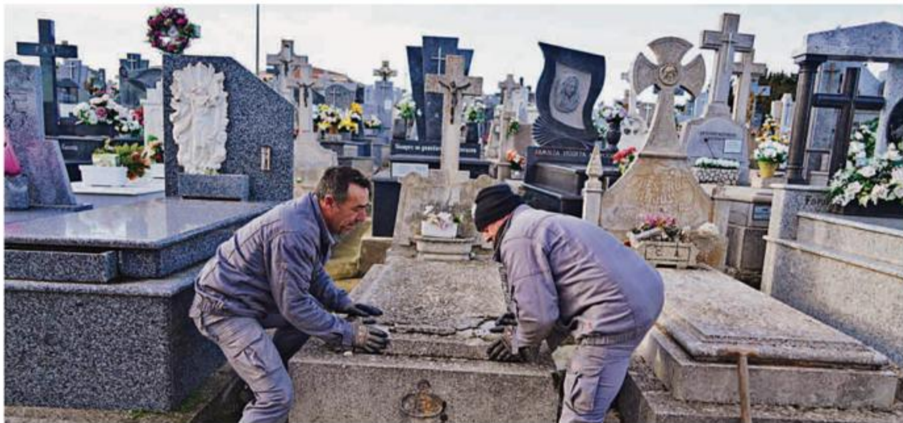
Dos trabajadores del cementerio San Carlos Borromeo desplazando una lápida que se encuentra muy deteriorada. MANUEL LAYA

● Es, después de Santander , la provincia en la que más se ha disparado el número de defunciones en los últimos doce meses