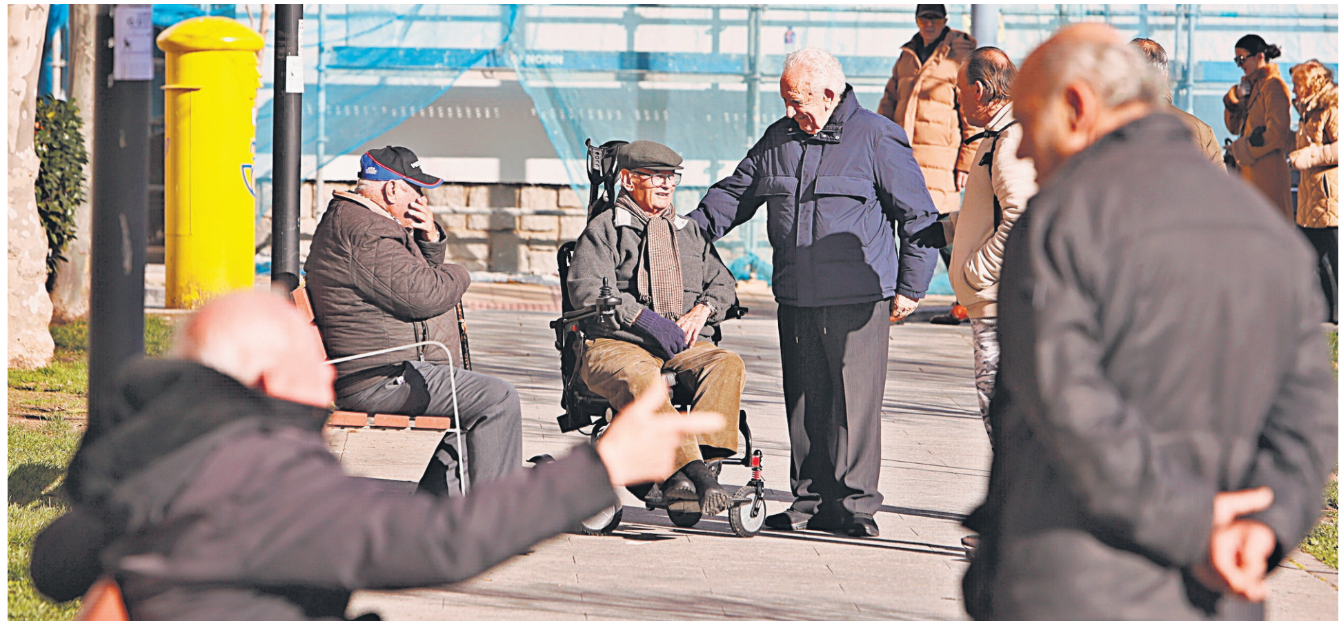
Varios grupos de personas mayores conversando y paseando en una zona verde de la ciudad. ALMEIDA

➔ No hay provincia de España con mayor esperanza de vida al nacer. El salmantino vive un año y nueve meses más que la media española. La media nacional se sitúa en 84,01 años, y en Salamanca se eleva a 85,77 (85 años y nueve meses). Pero no solo un recién nacido salmantino tiene estadísticamente unas expectativas de vivir más tiempo que cualquier otro niño que venga al mundo en cualquier otra parte del país, también los mayores de 65 años que residen en esta provincia son los que cuentan con la mayor esperanza de vida de toda España, concretamente unos 23,15 años más.